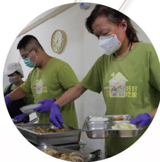
台南市安南區 門諾照顧關懷及共餐據點