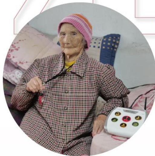
花蓮偏鄉 獨居防跌守護連線服務