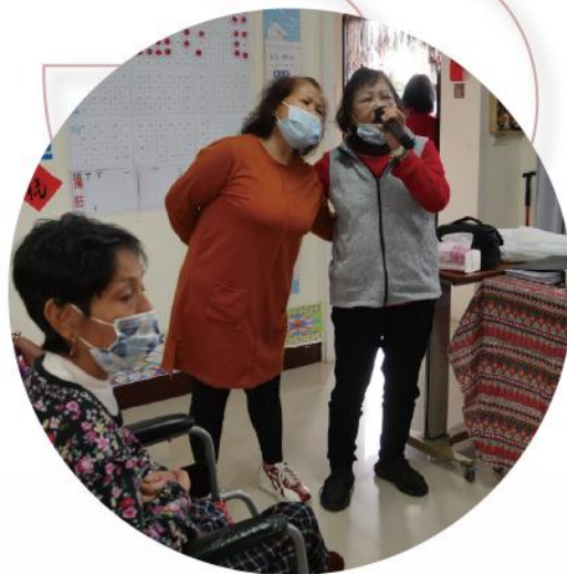
花蓮太魯閣 樂齡據點長輩共餐服務