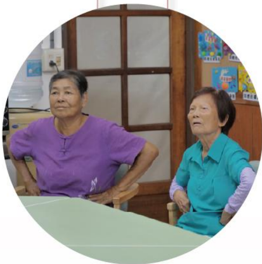
台東縣長濱鄉失智照顧 東河鄉照顧者喘息支持