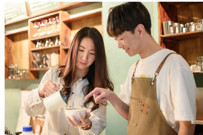
少年學習咖啡拉花

隨著中繼職場經營規模擴大，同時顧及經營與少年培訓變得兩難，除了需要有更專業的經營管理資源投入，協助改善現有狀況，也需要更充足的人力，穩固兩邊的需求。