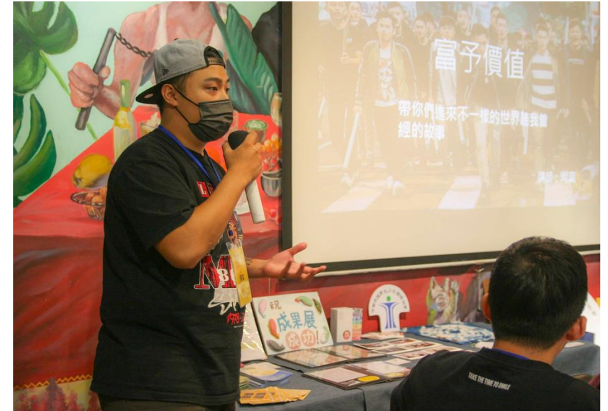
阿富為自己的生命故事「富予價值」

現在的阿富是協會志工，並加入了少年故事發聲計畫，以自身經驗引導迷失青少年走向正軌。