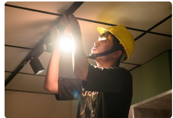
少年進行水電修繕實作課程