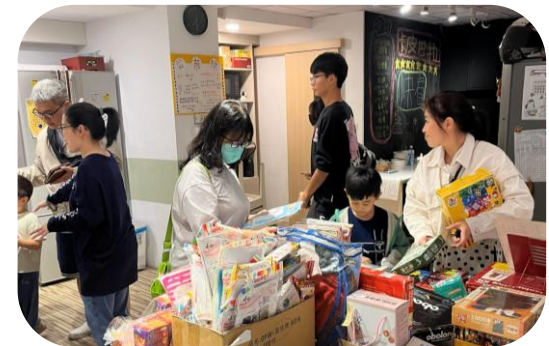
陪孩子一同辦理社區二手市集